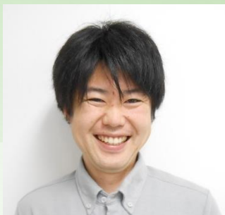
リーダーの 梯(かけはし)です。