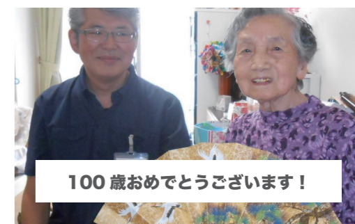
100歳おめでとうございます!