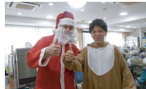
皆様で元気に合唱されました (柴田)