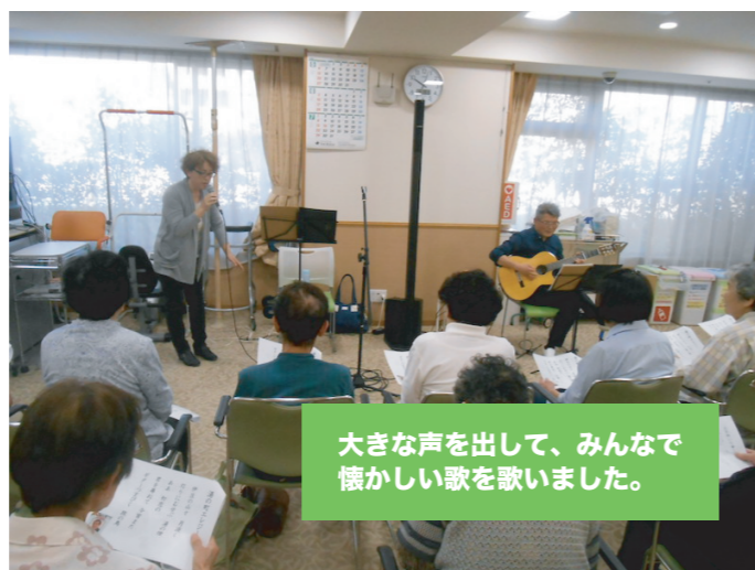
大きな声を出して、みんなで懐かしい歌を歌いました。