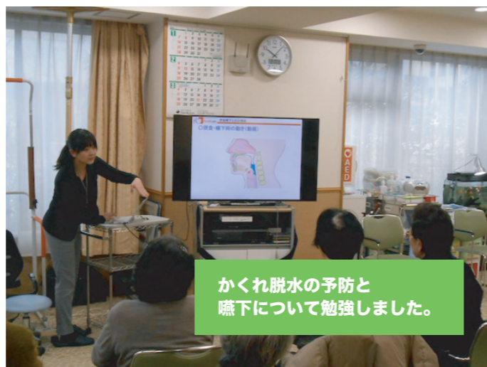
かくれ脱水の予防と嚥下について勉強しました。