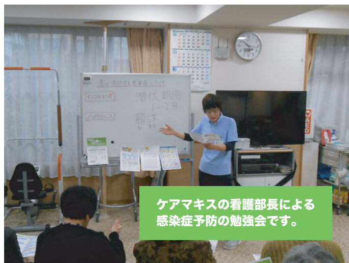
ケアマキスの看護部長による感染症予防の勉強会です。

社会福祉法人ケアマキスでは、地域の方が困っていることを気軽に相談できる「なんでも相談会」を毎月開催しております。