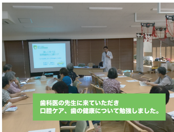
歯科医の先生に来ていただき口腔ケア、歯の健康について勉強しました。