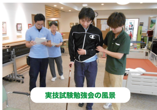
実技試験勉強会の風景

定期「ケアマイスター試験」が始まりました！認定クラスは5段階。筆記・実技の試験を通して自身のレベルアップを図ります。